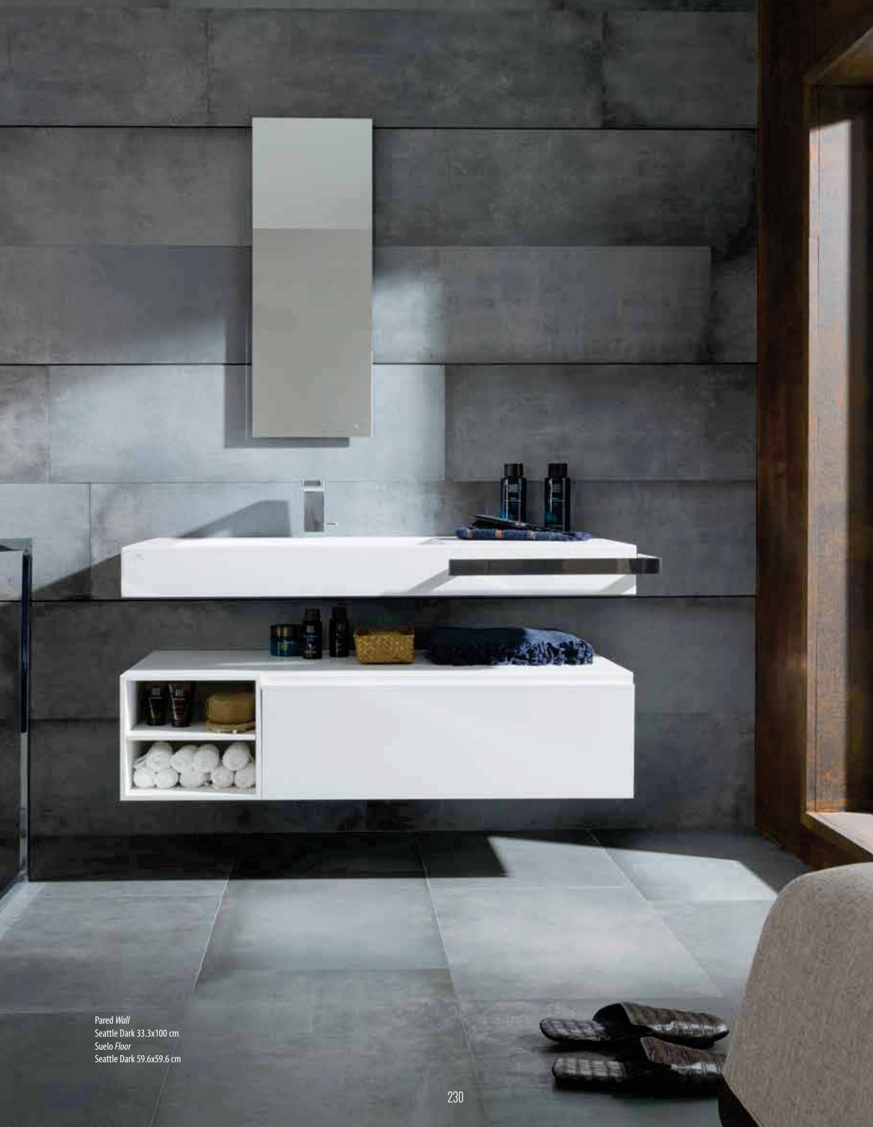
Pared Wall Seattle Dark 33.3x100 cm Suelo Floor Seattle Dark 59.6x59.6 cm